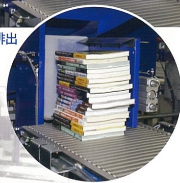
スタッキング機能